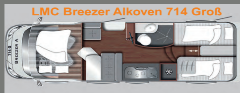
Gesamtlänge: 7,35m Sitz/Schlafplätze 5-5

Vollintegrierter bis zu 4 Personen 3,5t. zGG 140 PS