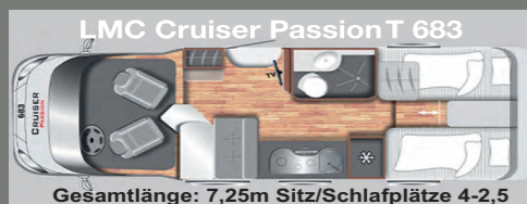
Gesamtlänge: 7,25m Sitz/Schlafplätze 4-2,5