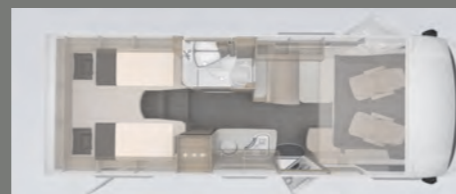
Gesamtlänge: 6,98m Sitz/Schlafplätze 4-4

Teilintegrierter bis zu 4 Personen 3,5t. zGG 130 PS