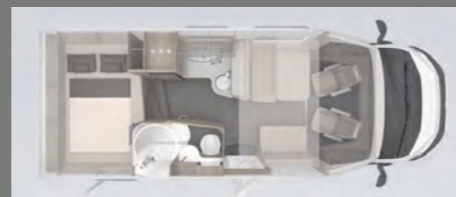
Gesamtlänge: 6,98m Sitz/Schlafplätze 4-4

Alkovenfahrzeug bis zu 5 Personen 4,0t. zGG 150 PS